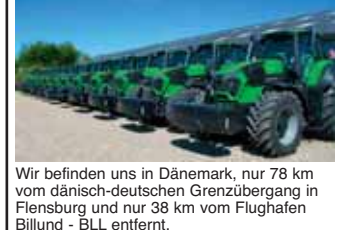
Wir befinden uns in Dänemark, nur 78 km vom dänisch-deutschen Grenzübergang in Flensburg und nur 38 km vom Flughafen Billund - BLL entfernt.

Da wir in großen Mengen kaufen, bekommen wir auch gute Preise dafür. Je mehr Sie kaufen, desto günstiger ist der Preis Lintrup Maskinhandel Skovlundvej 1 6660 Lintrup DK Tel. +45-74855292 www.limas.dk