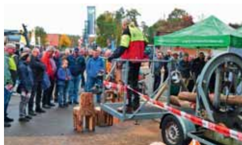
Am Spannungssimulator wird gezeigt, wie man Holzstämmchen, die unter Spannung stehen, sicher bearbeitet.

und nachhaltiger Forstwirtschaft runden das Thema ab. Auch Wärmepumpen, Solaranlagen, Windkraft, bis hin zur Elektromobilität sind Thema der Veranstaltung. Die Ausstellung ist am 26. und 27. 10. 2024 täglich von 10.00 bis 16.00 Uhr geöffnet. Eintritt: 10,- Euro, Kinder und Jugendliche unter 18 Jahren sind frei. Mit dem einmaligen Eintritt können alle genannten Ausstellungsbereiche besucht werden. Info: www.messe-leese.de