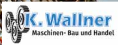
ROLLCRUST - MASTER - ROLLHACKE